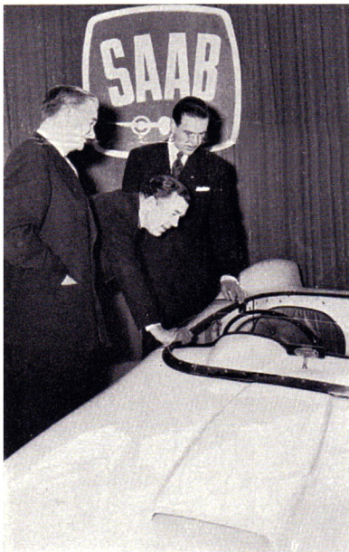
Ci-dessus: Le prototype de la Saab Sonett Super Sport.